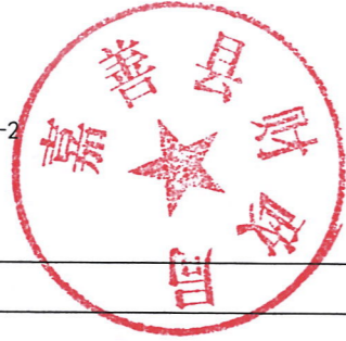
浙江省政府新增专项债券存续期对应项目情况表（土地储备专项债券）